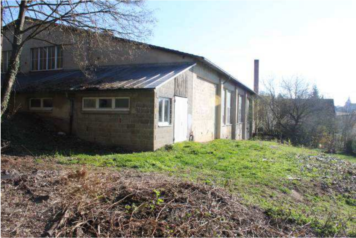
Abb. 2: Gewerbegebäude von Südwesten