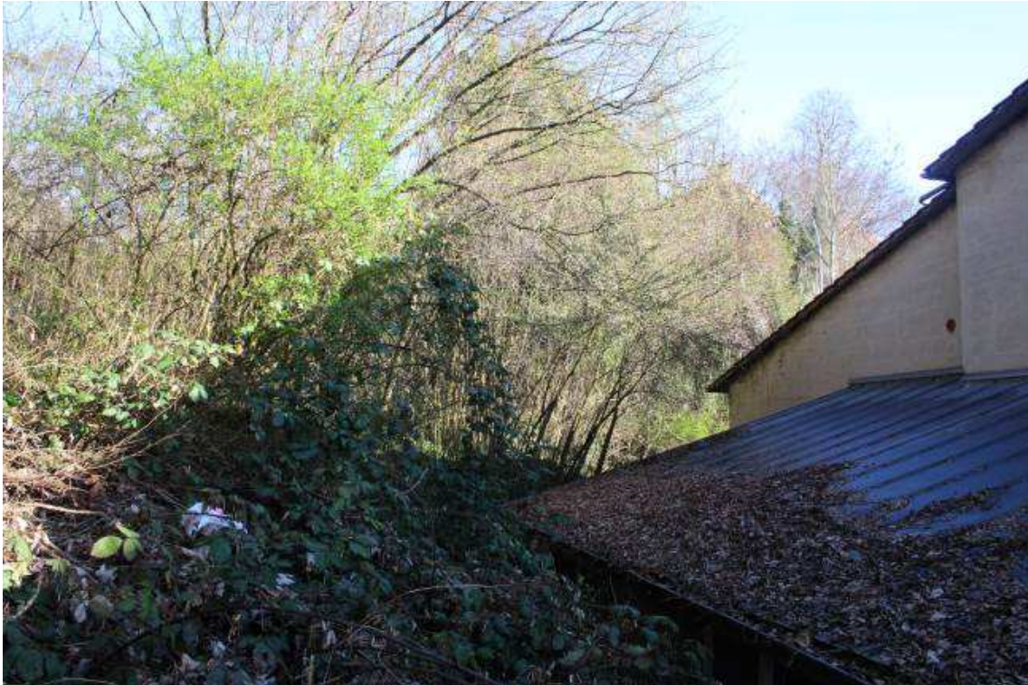
Abb. 4: Hangbereich im Westen und Norden