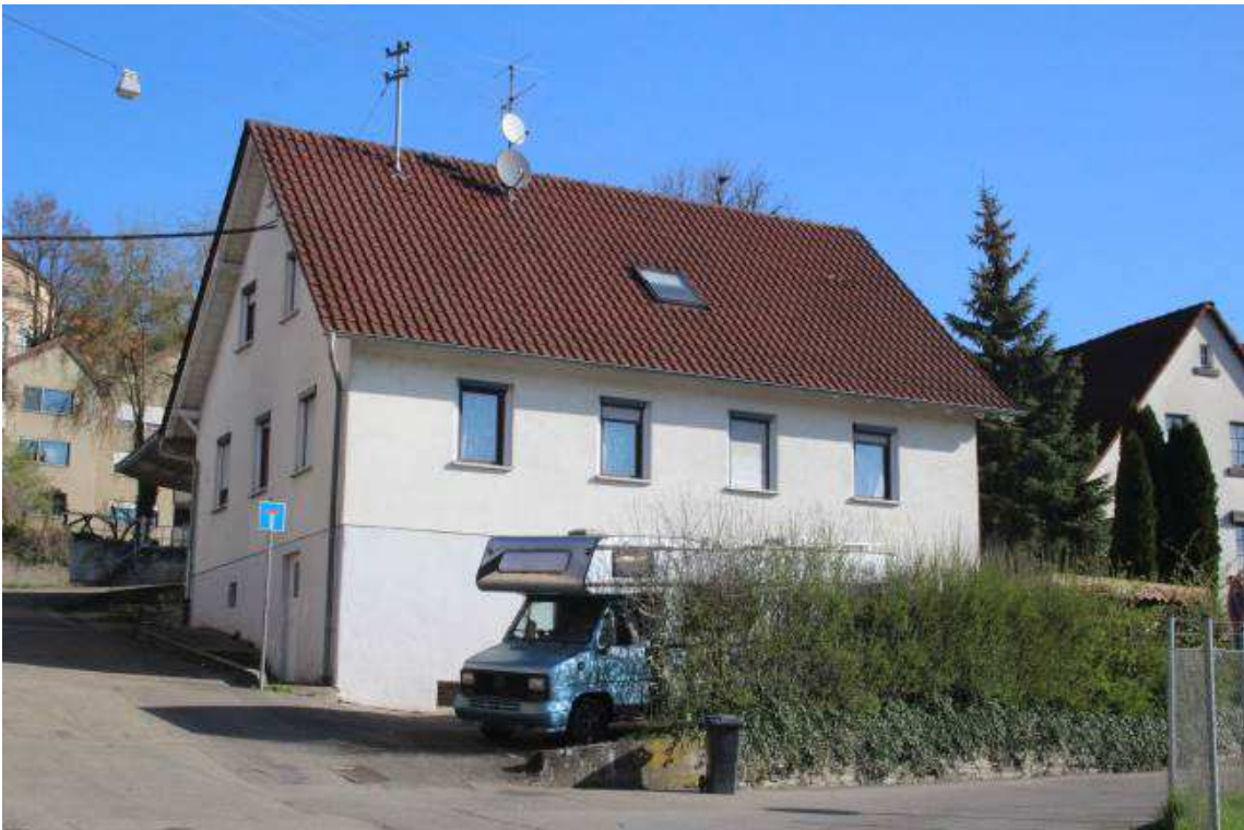
Abb. 3: Lager- und Wohnhaus im Osten